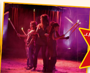
Fakire, Feuer, Fantasie