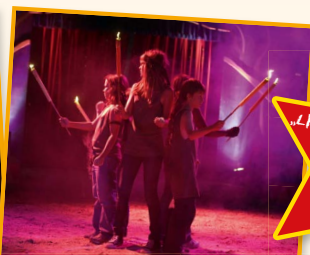
Fakire, Feuer, Fantasie